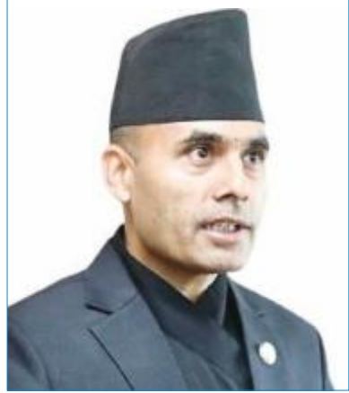
सूचना तथा सञ्चारमन्त्री डा. विक्रम तिमिल्सिना

राष्ट्रिय समाचार समिति काठमाडौं, जेठ १२ गते