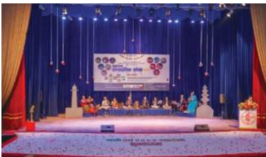
२. चण्डालीका नृत्य: सांस्कृतिक संस्थान